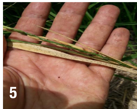
Las fotos 1, 2, 3 y 4 muestran los síntomas de la enfermedad, la cual fue detectada a nivel de toda la planta. La foto 5 muestra el impacto de la enfermedad en el llenado del grano y los puntos negros en las hojas, conocidos como peritecios.