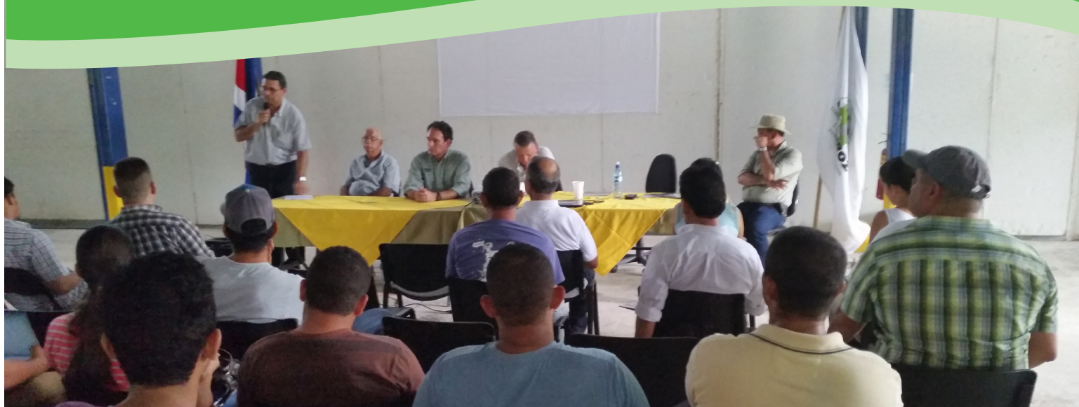
Un total de 34 productores asistieron al acto inaugural, en la empresa Melones del Sol, en Santa Rita de Nandayure.

Ofrecer un mejor servicio de extensión en el sector arrocero de la Península de Nicoya, será el propósito de la apertura de la Escuela Nacional del Arroz (ENA), que abrió sus puertas a 34 nuevos agricultores estudiantes, en la empresa Melones del Sol, en Santa Rita de Nandayure.