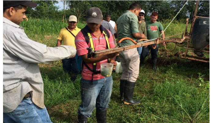
Productores arroceros de la Huetar Norte se capacitaron en clases de aspersión, impartidas por técnicos del INA.

El INA cuenta con instalaciones en las cinco regiones arroceras y durante el 2014, se graduaron 138 productores en cursos técnicos de administración, contabilidad y mercadeo agropecuario, impartido por capacitadores de esa entidad autónoma.