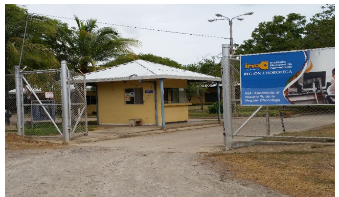
El INA cuenta con un centro de capacitación ubicado en La Soga, en el Distrito de Riego Arenal- Tempisque, en Bagaces.