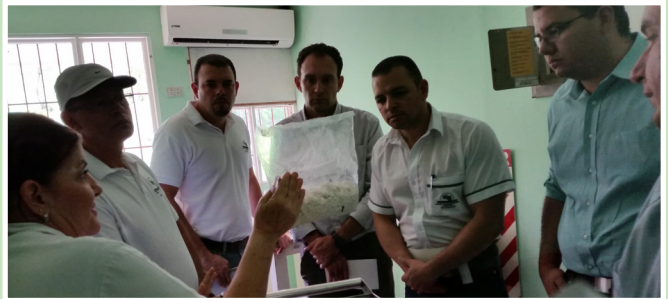
Compartiendo experiencias. Personal de Conarroz visitó las instalaciones de Dieca para conocer sobre los procedimientos investigativos, que ahí se elaboran como la producción de controladores biológicos a base de arroz para el cultivo de la caña de azúcar.