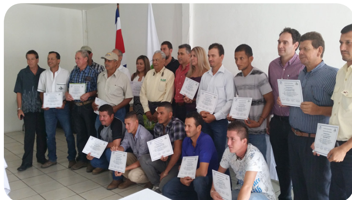
Primera promoción de graduados de la Escuela Nacional del Arroz, en la Región Huetar Atlántica.