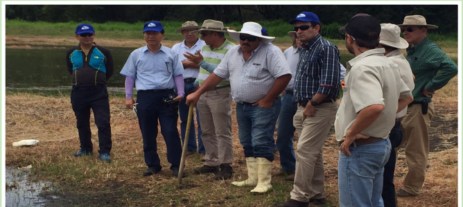
Misión surcoreana. Funcionarios de Conarroz compartieron con miembros de la misión de Corea del Sur, interesados en desarrollar proyectos de riego en arroz, conjuntamente con Senara y Conarroz, en el Distrito de Riego Arenal- Tempisque (Drat).