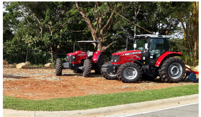
En región Huetar Atlántica se impartió el curso sobre manejo de tractores agrícolas, a productores arroceros. Esta capacitación se trasladaría posteriormente a Upala, Huetar Norte.