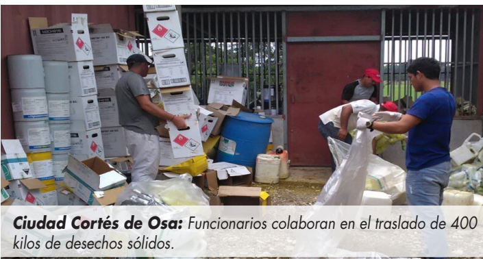
Ciudad Cortés de Osa: Funcionarios colaboran en el traslado de 400 kilos de desechos sólidos.

En el cantón de Osa en esta iniciativa, representantes del SFE, Dirección de Extensión MAG- OSA, FLNC y Conarroz, quienes recolectaron 400 kilos, en San Buenas, Las Parcelas, Agrosur, Cortés, Palmar, La Palma, Palmar Sur, finca 2-4. Sierpe, Finca 6-11, Finca, 10, 5, 8, 9, 7, Camíbar, Camaronera, Finca 12, Piedras Blancas, Tinoco, Finca Alajuela, Puntarenas, Guanacaste, Salama, Villa Colón, Puerta del sol, Olla Cero, Cipa, Santa Rosa y La Guaria.