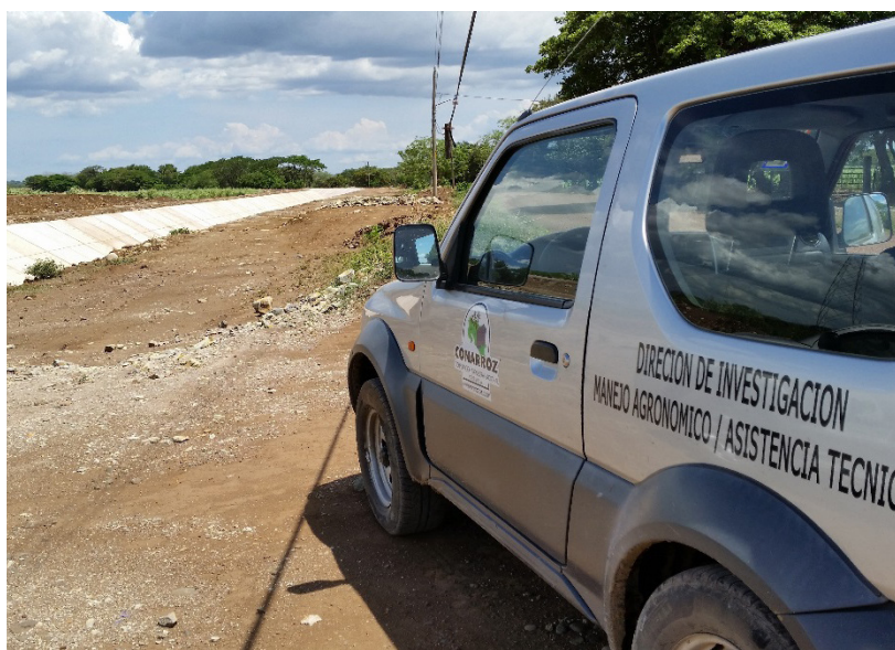
Conarroz recorrió el nuevo curso del Canal del Sur, que amplía hacia Abangares la siembra arrocerera bajo riego, en el Drat, donde se cultivan actualmente 8.500 has.