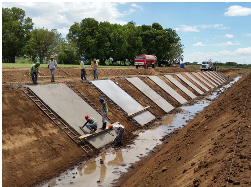
La prolongación, en 33 kms.,del Canal del Sur beneficiará en 1.000 has al sector arrocerero.

Actualmente en el Drat se cultivan 8.500 hectáreas de arroz por lo que con la ampliación se elevaría a 9.500 hectáreas, que anualmente se cosecharán del grano, con agua procedente del Embalse de Arenal, después de su uso para la generación eléctrica, través de las plantas hidroeléctricas del Instituto Costarricense de Electricidad (ICE).