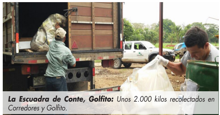
La Escuadra de Conte, Golfito: Unos 2.000 kilos recolectados en Corredores y Golfito.