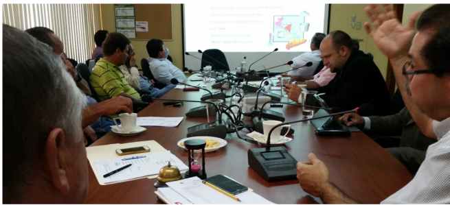
Clima. La Junta Directiva de Conarroz recibió la visita de representantes del Instituto Meteorológico Nacional (IMN), quienes expusieron las tendencias del clima ante la amenaza del fenómeno de El Niño en las regiones arroceras.