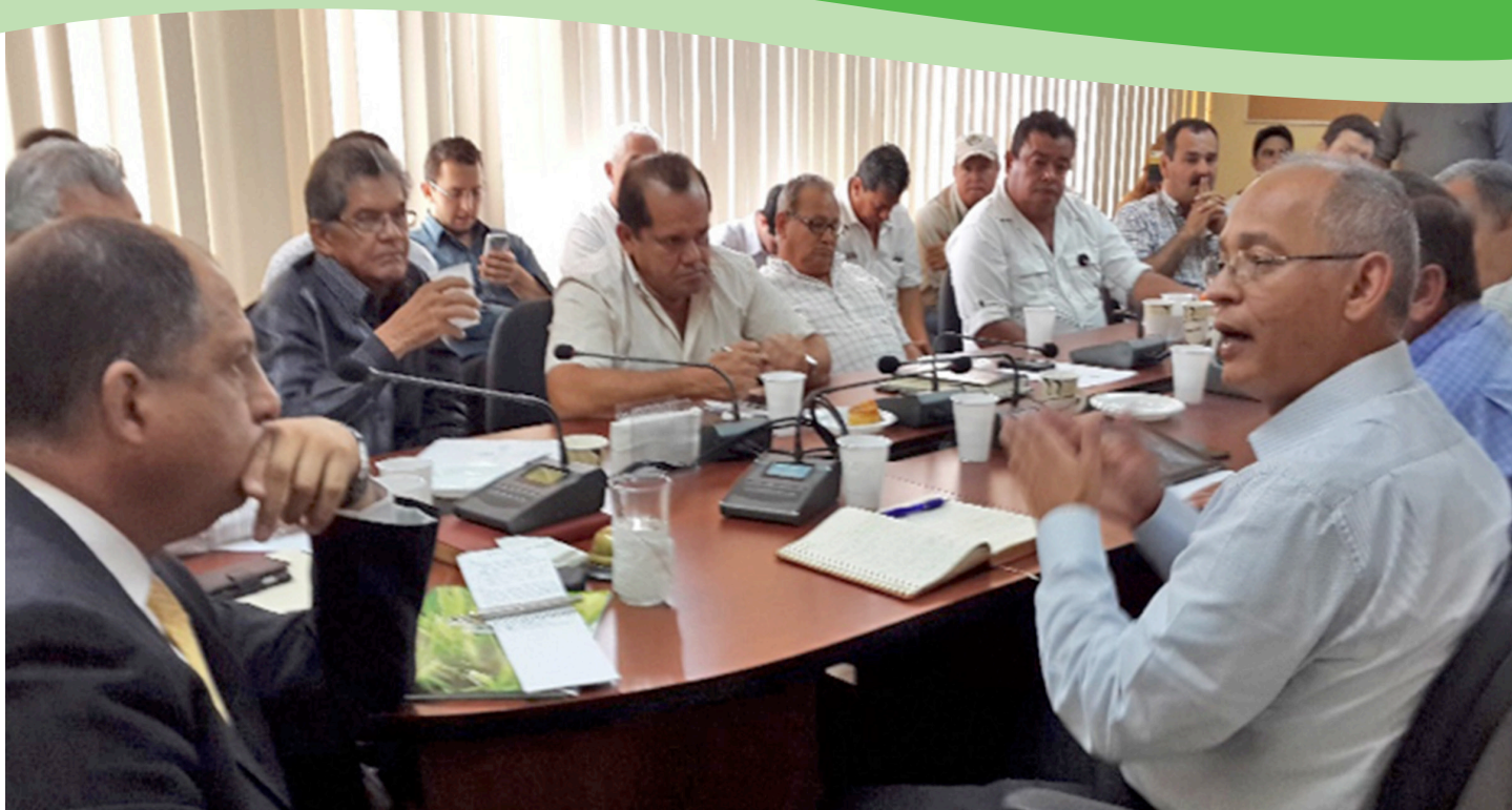
El sector arrocero expuso al presidente Luis Guillermo Solís, su posición referente a la Alianza del Pacífico.

El sector arrocero nacional se opone a la adhesión de Costa Rica al Bloque de la Alianza del Pacífico, por considerarla una amenaza para esta actividad y el sector agropecuario, al buscar acelerar los procesos de desgravación arancelaria, inclusive de productos sensibles.