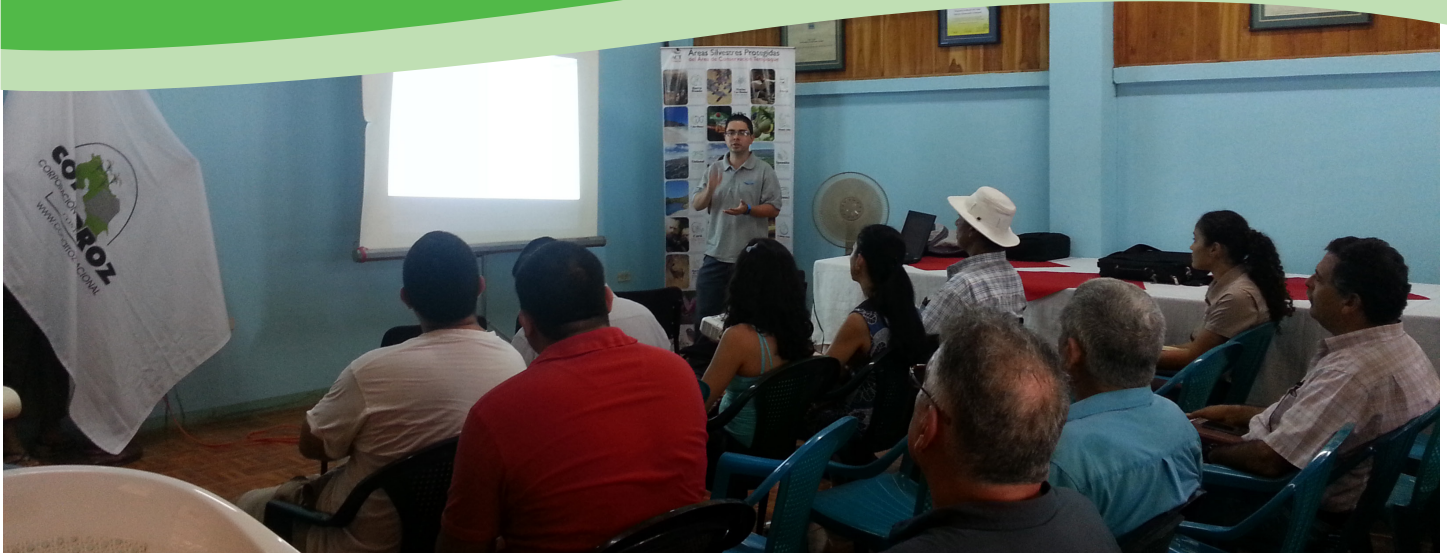
En Nicoya inició la capacitación sobre el trámite de permisos para concesionar agua de ríos y pozos.

Enseñar a los productores arroceros a cómo tramitar solicitudes de permisos para una concesión de aprovechamiento de agua de ríos y perforación de pozos, será la finalidad de los cursos a impartir por la Dirección de Aguas y la Corporación Arrocera Nacional (Conarroz), en las regiones productoras del grano, principalmente aquellas donde se cultiva en secano.