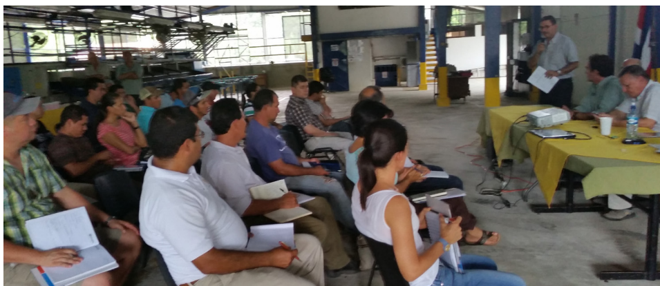
La Escuela Nacional del Arroz se fundó en el 2013 bajo el Convenio Conarroz-UTN.

El área de secano de la Península de Nicoya, en la bajura de la región Chorotega, cultivará en este periodo 2015-2016, un estimado de 5.237 hectáreas a cargo de 112 productores. En Costa Rica, el 70% del cultivo de arroz se siembra bajo esta modalidad, mientras que principalmente en la altura de la provincia de Guanacaste, se utiliza el sistema bajo riego, como modelo de plantación.