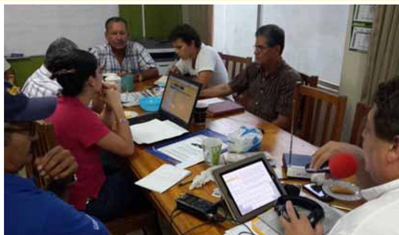
La Voz del Arrocero desde la Sucursal Brunca de Conarroz, en Ciudad Neilly