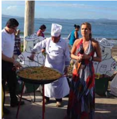
Cooparroz, encuentro navideño Puntarenas