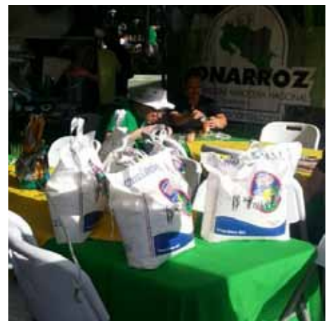
Arrocera Liborio, encuentro navideño Desamparados