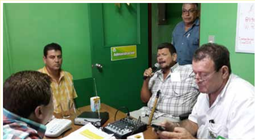
La Voz del Arrocero desde la Sucursal de Conarroz en la Huetar Atlántica, en La Rita de Guápiles