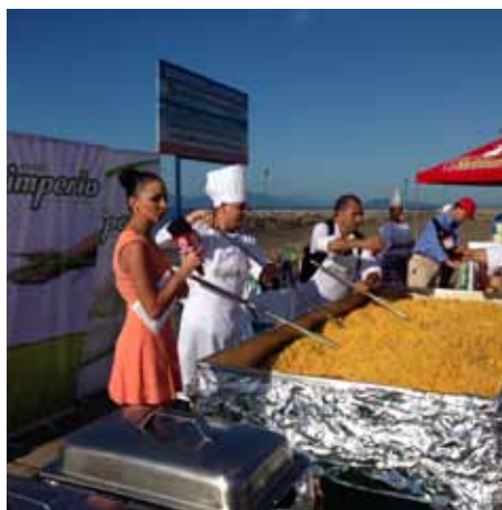
Arrocera Costa Rica, encuentro navideño Puntarenas