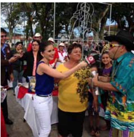
El galán, encuentro navideño Paraíso

Durante estas actividades cientos de costarricenses compartieron diferentes platillos de arroz, entre ellos vecinos de los barrios del sur en Desamparados, así como consumidores cartagineses y puntarenenses, tras atender Conarroz la invitación de la revista televisiva de Repretel.