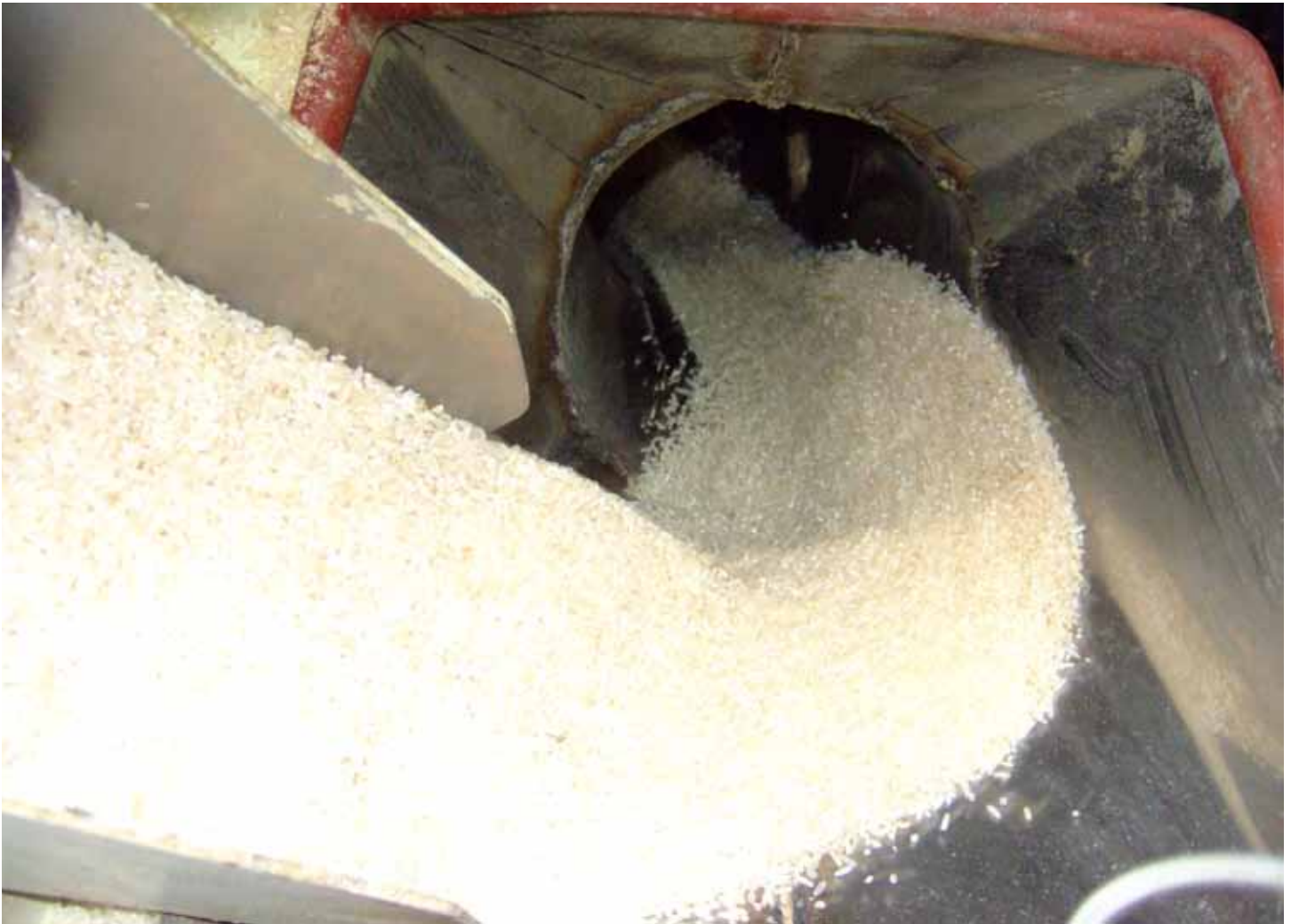
En la crisis del 2008, los precios del arroz se duplicaron en menos de un año.

A pesar de esto, parece que los mercados internacionales del arroz compiten entre sí en cierta medida, pero la promesa de un mayor progreso depende en gran medida de la voluntad de los gobiernos para intervenir en el comercio de arroz o si deciden recurrir a otras políticas que distorsionen menos los precios con el fin para ayudar a sus productores y consumidores de arroz. http://arroz.com/content/oryza-comparte-hallazgos-acad%C3%A9micos-%C2%BFson-competitivos-los-precios-internacionales-del-arroz#sthash.ZM91thIN.dpuf