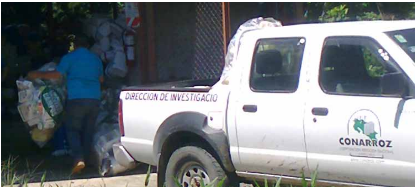
La campaña de recolección de envases continuará durante el 2014.