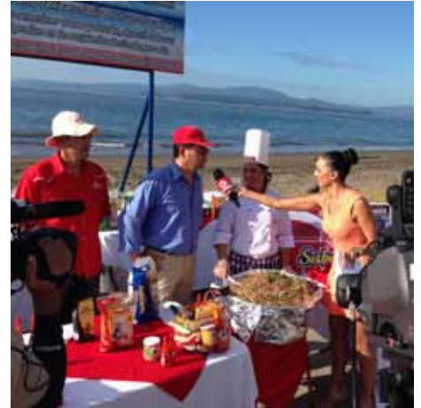
CoopLiberia, encuentro navideño Puntarenas

Más de 20 mil platos de arroz con pollo, arroz con mariscos y gallo pinto, se repartieron en el marco de la Campaña Consuma Arroz: El arroz va con todo, durante los encuentros navideños, celebrado en coordinación con el programa Giros de Repretel.