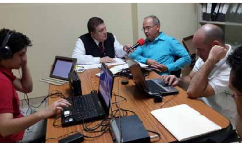
El 12 de noviembre del 2013 salió al aire la primera edición del programa La Voz del Arrocero