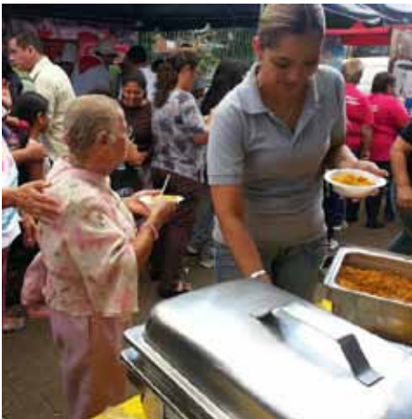
Conarroz, encuentro navideño Desamparados