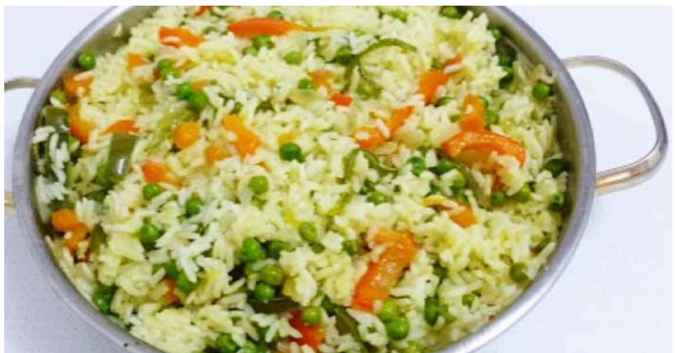
Arroz primavera receta light