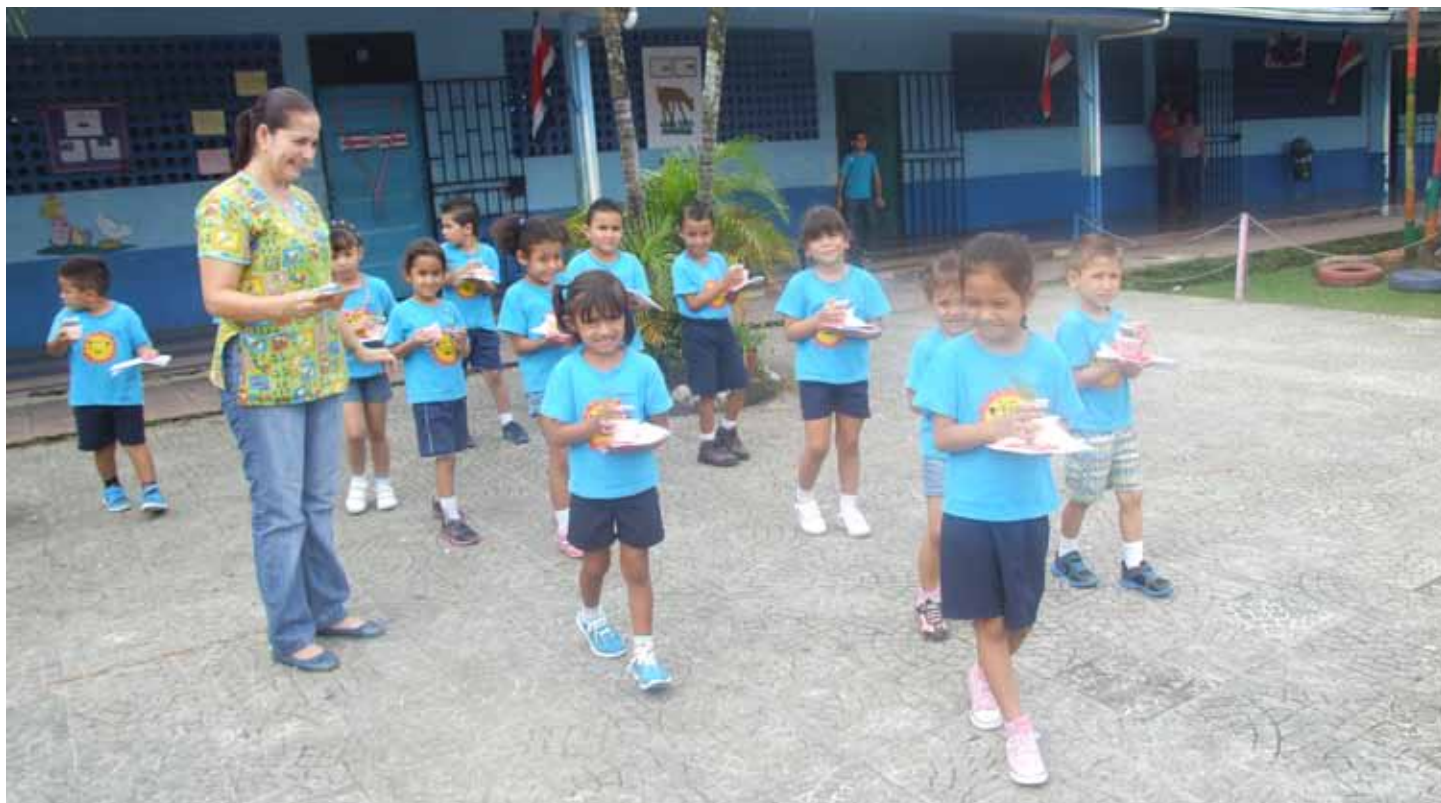
Estudiantes del Kinder de la Escuela Alberto Echandi Montero de Ciudad Neilly, Corredores.

La Escuelita del Arroz, nació con la celebración del Día Infantil Arrocero, una actividad de Conarroz, que se realiza durante setiembre en el Paseo Colón, en conmemoración al Día del Niño.