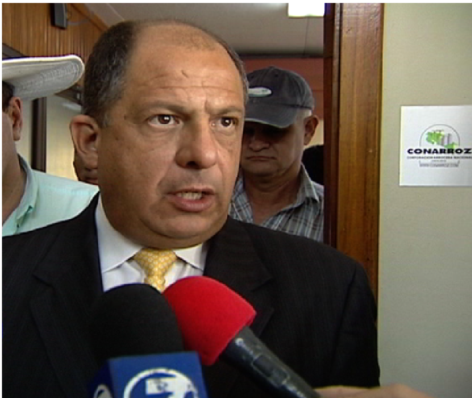
Luis Guillermo Solís encuentra acuerdo con los arroceros y la Asociación Bancaria Costarricense