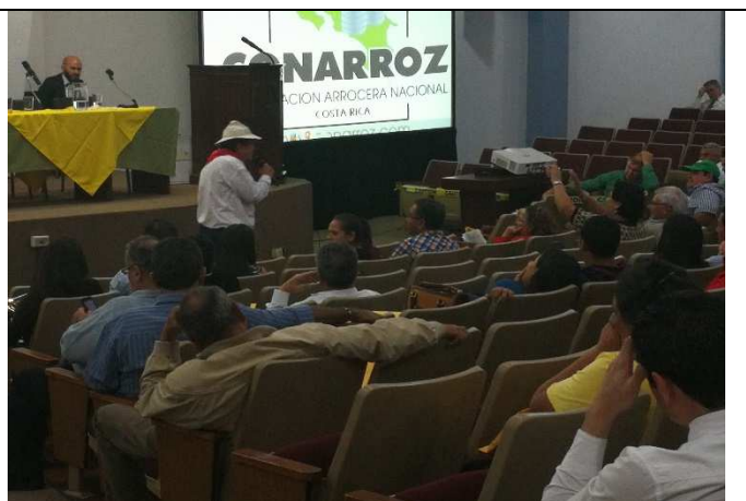
El sector ante el humor campesino.