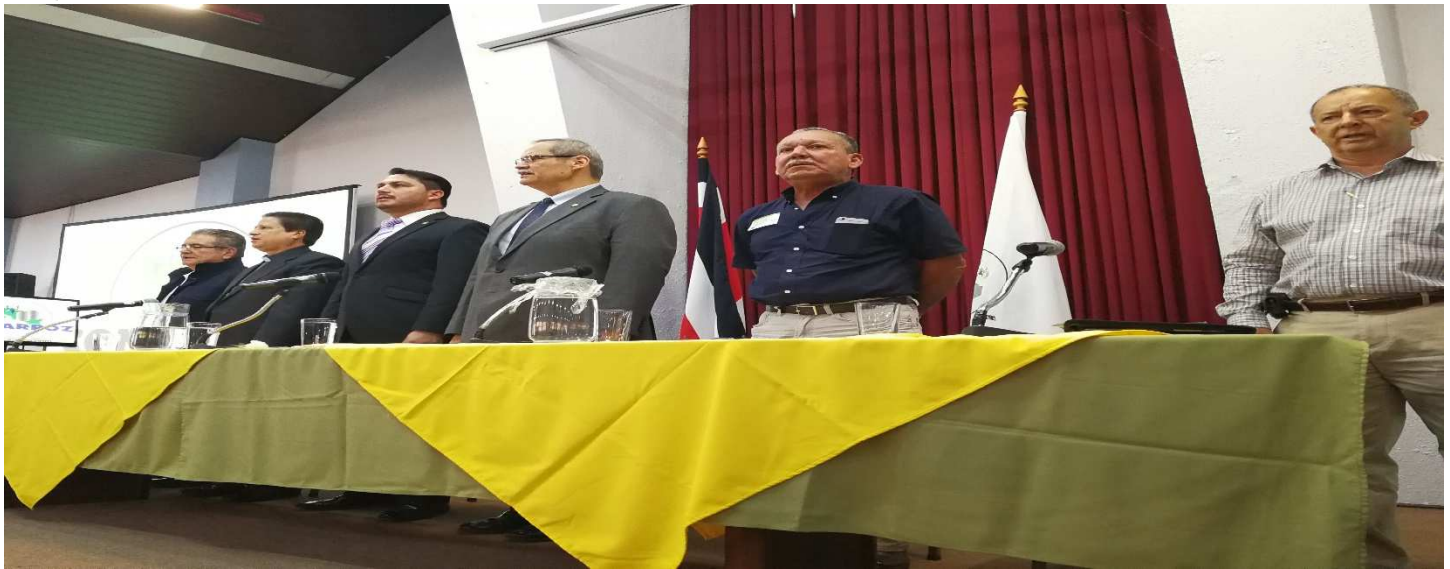
Ceremonia de inauguración del XIII Congreso Nacional Arrocero 2017, celebrado en el auditorio de la Conferencia Episcopal en San José.