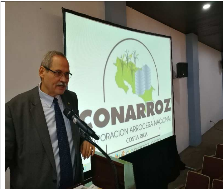
Luis Felipe Arauz, Ministro de Agricultura y Ganadería