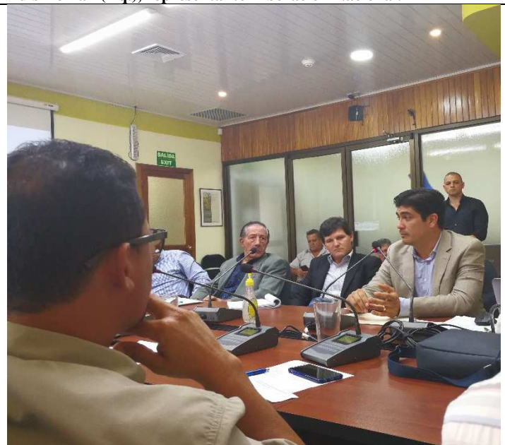
Carlos Alvarado (der.), candidato Acción Ciudadana.

Tres de los aspirantes a la Presidencia de la República y un delegado partidista, acudieron a una especie de cabildo abierto con representantes del sector arrocero, en el marco de los tradicionales “Desayunos arroceros”, convocados por Conarroz, previo a las elecciones de febrero próximo en la que se escogerá al futuro gobernante del país.